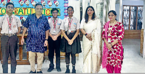
सोनीपत। विजेता प्रतिभागियों के साथ प्रधान, प्राचार्या एवं अन्य।