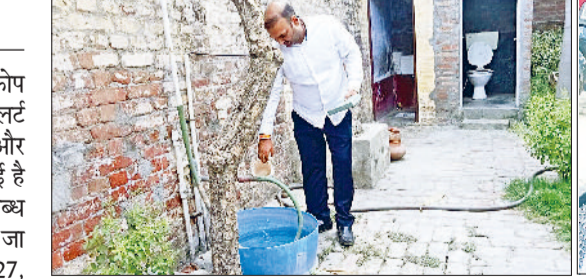
सोनीपत। घरों में लारवा की जांच करते और स्लाइड के संभावितों के सैपल लेते स्वास्थ्य कर्मों।

जिले में डेंगू और मलेरिया के बढ़ते प्रकोप को देखते हुए स्वास्थ्य विभाग ने अलर्ट जारी कर दिया है। चिकित्सकों और स्वास्थ्य कर्मियों की ड्यूटी लगा दी गई है ताकि मरीजों को समय पर इलाज उपलब्ध हो सके और बीमारी को फैलने से रोका जा सके। अब तक जिले में डेंगू के 27, मलेरिया के 11 और चिकनगुनिया का एक मरीज मिलने की पुष्टि हो चुकी है। हालांकि राहत की बात यह है कि सभी मरीज स्वस्थ हैं और किसी भी प्रकार की गंभीर स्थिति सामने नहीं आई है। विभाग की टीम घर-घर जाकर लोगों को जागरूक करने व लापरवाही बनेतने वालों को नोटिस देने का काम कर रहे हैं।