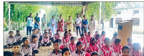
सोनीपत। कार्यक्रम के दौरान मौजूद बच्चे व स्टाफ।