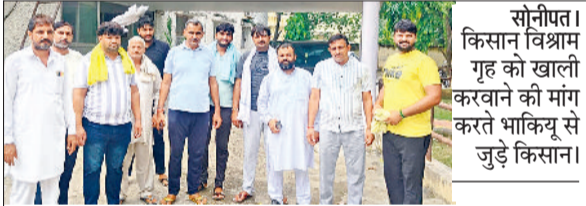
सोनीपत। किसान विश्राम गृह को खाली करवाने की मांग करते भाकियू से जुड़े किसान।

चौ. देवीलाल चीनी मिल आहुलाना के किसान विश्राम गृह में लेबर ठहराने का भारतीय किसान यूनियन चहूनी (भाकियू) ने कड़ी आपत्ति जताई है। यूनियन से जुड़े किसानों ने शुक्रवार को चीनी मिल पहुंचकर रोष व्यक्त किया व किसान सिंचाई विश्रामगृह को खाली करवाने की मांग की। किसानों ने स्पष्ट कहा विश्रामगृह किसानों के लिए है लेबर