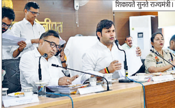
शिकायतें सुनते राज्यमंत्री।

गलत पेंशन की होगी रिकवरी, दिए निर्देश बैठक के दौरान गांव पट्टी