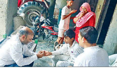
घर-घर जाकर संभावितों के सैपल ले रहे स्वास्थ्य कर्मों

रिपोर्ट पॉजिटिव आती है तो उसके घर और आसपास के क्षेत्रों में तुरंत फॉगिंग कराई जाती है, ताकि मच्छरों को पनपने से रोका जा सके। इन बीमारियों से बचाव का सबसे कम किया जा सकता है। बारिश के मौसम और आसपास की जगहों पर पानी जमा नहीं होने देगे और नियमित सफाई रखेंगे तो डेंगू और मलेरिया का खतरा काफी हद तक कम किया जा सकता है। बारिश के मौसम में गमलों, कुल्लों, पुराने टायरों व अन्य बर्तनों में पानी इकट्ठा न होने देना बेहद