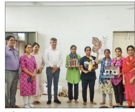
सोनीपत। वर्कशॉप के दौरान विद्यार्थियों के साथ प्राचार्य एवं अन्य।