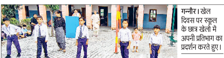
गन्नौर। खेल दिवस पर स्कूल के छात्र खेलों में अपनी प्रतिभा का प्रदर्शन करते हुए।