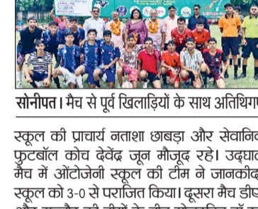
सोनीपत। मैच से पूर्व खिलाड़ियों के साथ अतिथिगण।