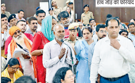
हाथ जोड़ की फरियाद।